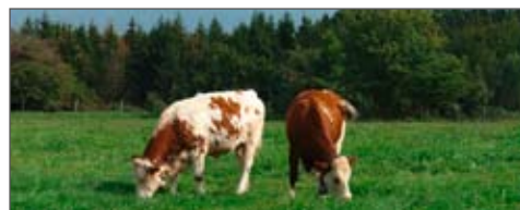
Gestaltung: Claudia Hurt

Mit der Anmeldebestätigung senden wir gerne einige Vorschläge dazu. Für den Sonntag in München bereiten wir Besichtigungsmöglichkeiten zur Auswahl vor (Info dazu bei Ankunft in der Jugendherberge).